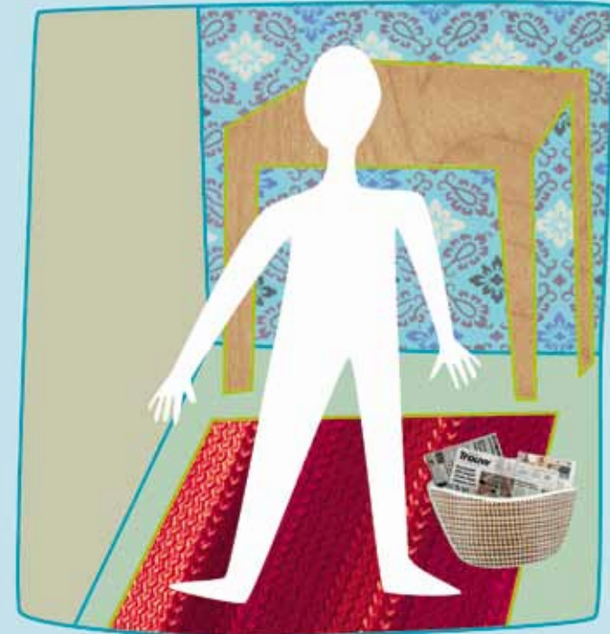
Mensen met borderline zeggen vaak dat ze zich van binnen leeg voelen

Mensen met borderline hebben vaak weinig zelfvertrouwen en een negatief beeld van zichzelf. Als mensen iets over hen zeggen, voelen ze dat snel als kritiek. Ze twijfelen veel over wat ze zullen gaan doen en wat ze met hun leven willen.