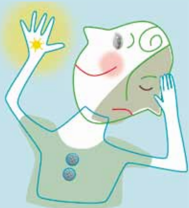
Mensen met borderline hebben twee kanten

Borderline ontstaat meestal tussen het zeventiende en vijfentwintigste levensjaar. Jaren waarin veel jonge mensen heftige emoties en veel veranderingen doormaken. Daarom is borderline moeilijk te herkennen. Daar komt nog bij dat de ene persoon met borderline heel impulsief en uitbundig is en de andere juist heel erg naar binnen gekeerd en depressief.