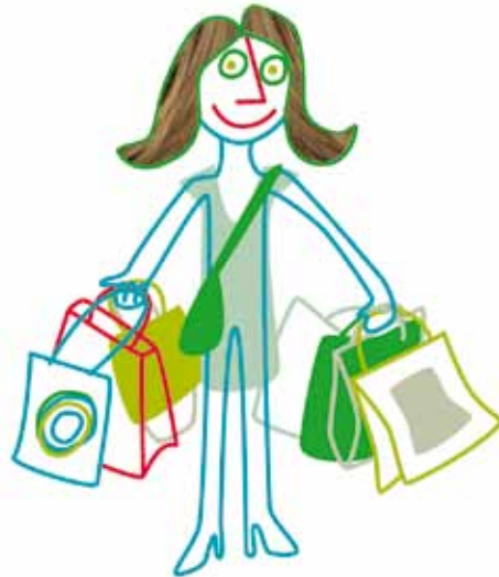
Een voorbeeld van impulsief gedrag is veel geld uitgeven

Impulsief wil zeggen dat mensen dingen doen zonder eerst na te denken over de gevolgen. Mensen met borderline zijn vaak impulsief. Voorbeelden van impulsief gedrag zijn: veel geld uitgeven, te veel alcohol drinken, te veel of juist te weinig eten en met veel verschillende mensen naar bed gaan. Ook woede-uitbarstingen horen hierbij.