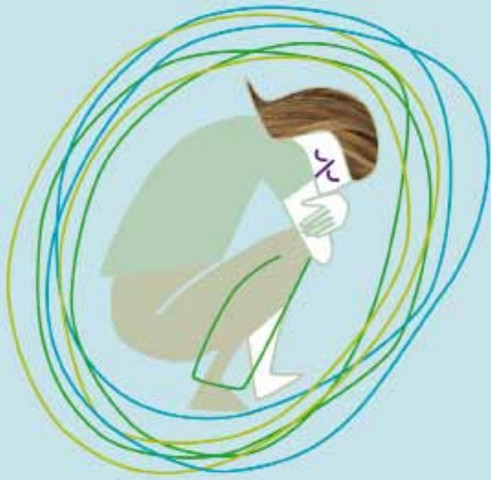
Alleen willen zijn

Een psychose kan ontstaan na een periode van stress of een moeilijke periode in iemands leven. Ook kan het een gevolg zijn van drugsgebruik of een depressie. Maar een psychose kan ook plotseling en zeer heftig opkomen.