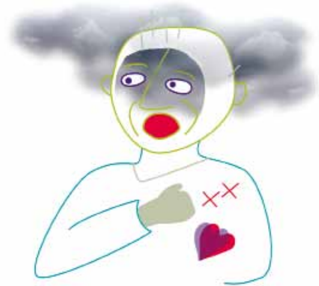
Een psychose is een angstige ervaring

Bij mensen met schizofrenie zijn afwijkingen in de hersenen gevonden. Ze hebben de ziekte al bij hun geboorte meegekregen. De ziekte wordt vaak pas later zichtbaar. Stress en belangrijke gebeurtenissen kunnen ervoor zorgen dat de ziekte zich ontwikkelt. Schizofrenie ontstaat dus niet door de opvoeding of door situaties in het gezin.